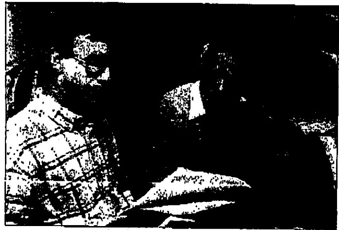
בן זקן המגילות הגנוזות, המגילות הגנוזות

מגילות הגנוזות הן כתובות עתיקות, שנכתבו בכתב עברי, ונחשפו לראשונה בשנת 1947. המגילות הן כתובות עתיקות, שנכתבו בכתב עברי, ונחשפו לראשונה בשנת 1947. המגילות הן כתובות עתיקות, שנכתבו בכתב עברי, ונחשפו לראשונה בשנת 1947.